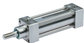
Vérins en acier inoxydable suivant la norme ISO 15552 diamètres du 32 au 125 mm