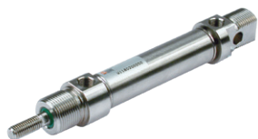
Vérins en acier inoxydable suivant la norme ISO 6432 diamètres du 16 au 25 mm