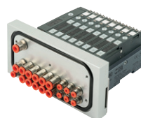
Ilots de distribution pour les zones de projection, série HDM, EB 80 de 4 à 16 électrodistributeurs