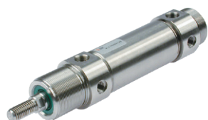
Vérins ronds en acier inoxydable diamètres du 32 au 63 mm