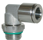
Racores automáticos en acero inoxidable AISI316, tubo de Ø 4 a 12 mm, rosca de M5 a 1/2"