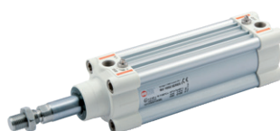
Cilindros serie HCR, High Corrosion Resistance (alta resistencia a la corrosión), norma ISO 15552, diámetros de 32 a 125 mm