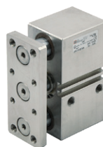
Cilindros especiales en acero inoxidable