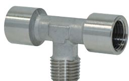
Racores estándar en acero inoxidable AISI316, roscas de 1/8" a 1/2"