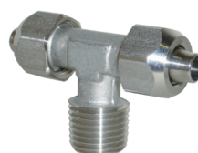
Racores de enchufe semirápido en acero inoxidable AISI 316, tubo de Ø 6 a Ø 10 mm, rosca de 1/8" a 1/2"