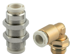
Racores automáticos en latón sin plomo serie F-E PLUS y F-NSF PLUS, tubo de Ø 4 a 10 mm, rosca de M5 a 1/2"