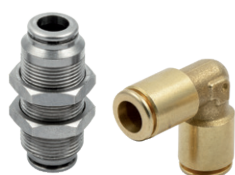
Racores automáticos en latón sin plomo serie F, tubo de Ø 4 a 10 mm, rosca de M5 a 1/2"