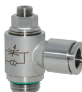
Reguladores de caudal en acero inoxidable AISI 316, roscas de 1/8" a 1/2"